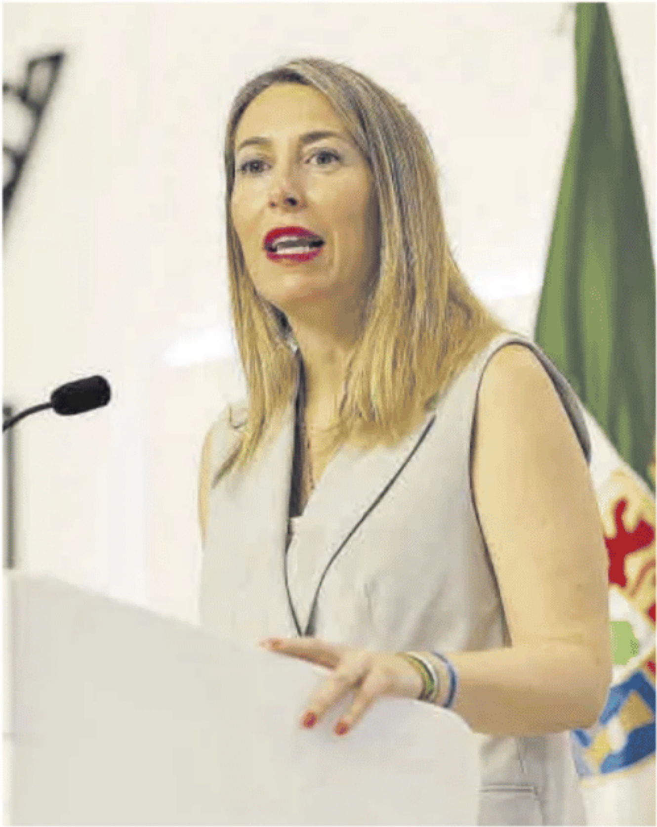
La presidenta de la Junta, María Guardiola, en una rueda de prensa.

ñola», que es el Fondo de Compensación Interterritorial. Fuentes de la Junta indicaron a este diario que Sánchez «defiende que el Estado pierda miles de millones de euros con el sistema propuesto de financiación singular para Cataluña, además de la condonación de 15.000 millones de su deuda, y ahora intenta contentar a las comunidades con solo 432 millones duplicando el Fondo de Compensación Interterritorial». «Esto atenta contra la dignidad y la igualdad de los españoles», aseguraron. «Está hablando (en alusión a Sánchez) de una cifra totalmente insuficiente y que representa solo migajas. Es una vergüenza absoluta con la que pretende reírse