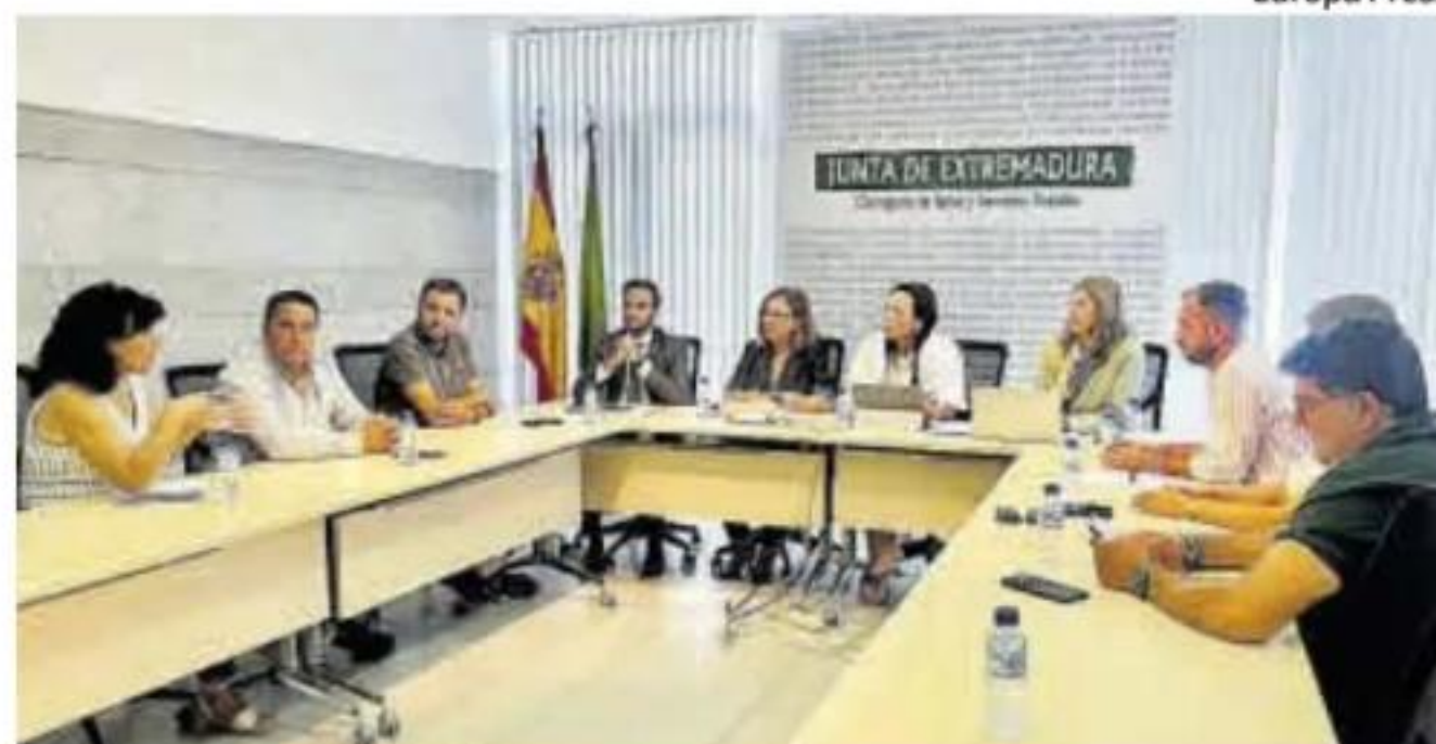
Encuentro de los alcaldes con las consejeras Espada y Morán, ayer.