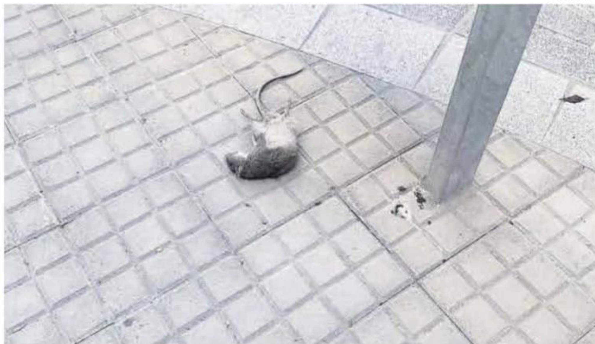
Rata muerta en la calle Rodríguez Moñino.

tras encontrarse una rata muerta en mitad de la vía. Testigos han pedido que la concesionaria de la limpieza debería actuar más y se han quejado del estado de los contenedores. El animal fue retirado a última hora de la mañana. ■