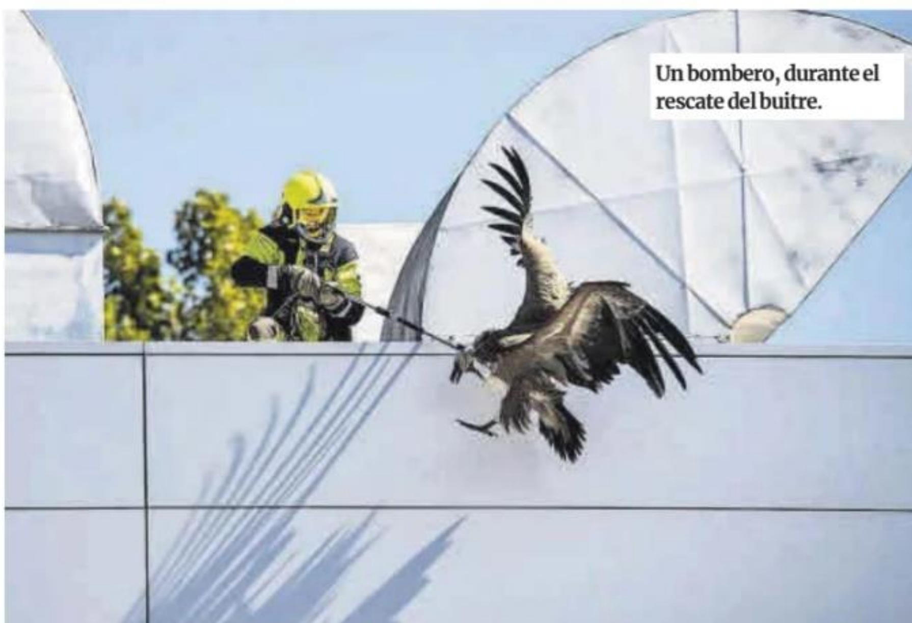
Un bombero, durante el rescate del buitre.