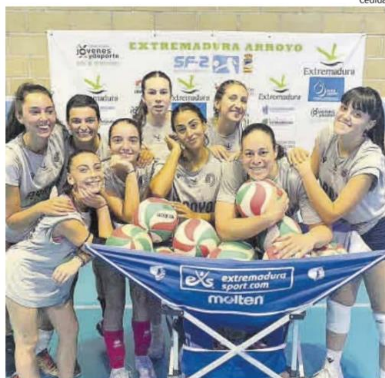
Plantilla del Extremadura Arroyo durante el primer entrenamiento.

Aunque no se quiere hablar de una fecha concreta para su llegada, en el club extremeño se confía en que pueda confirmarse su vuelo la próxima semana, para que las dos jugadoras adquieran un mínimo nivel físico y de adaptación a los nuevos sistemas de juego, que deberá medirse en los torneos previstos para final de septiembre.