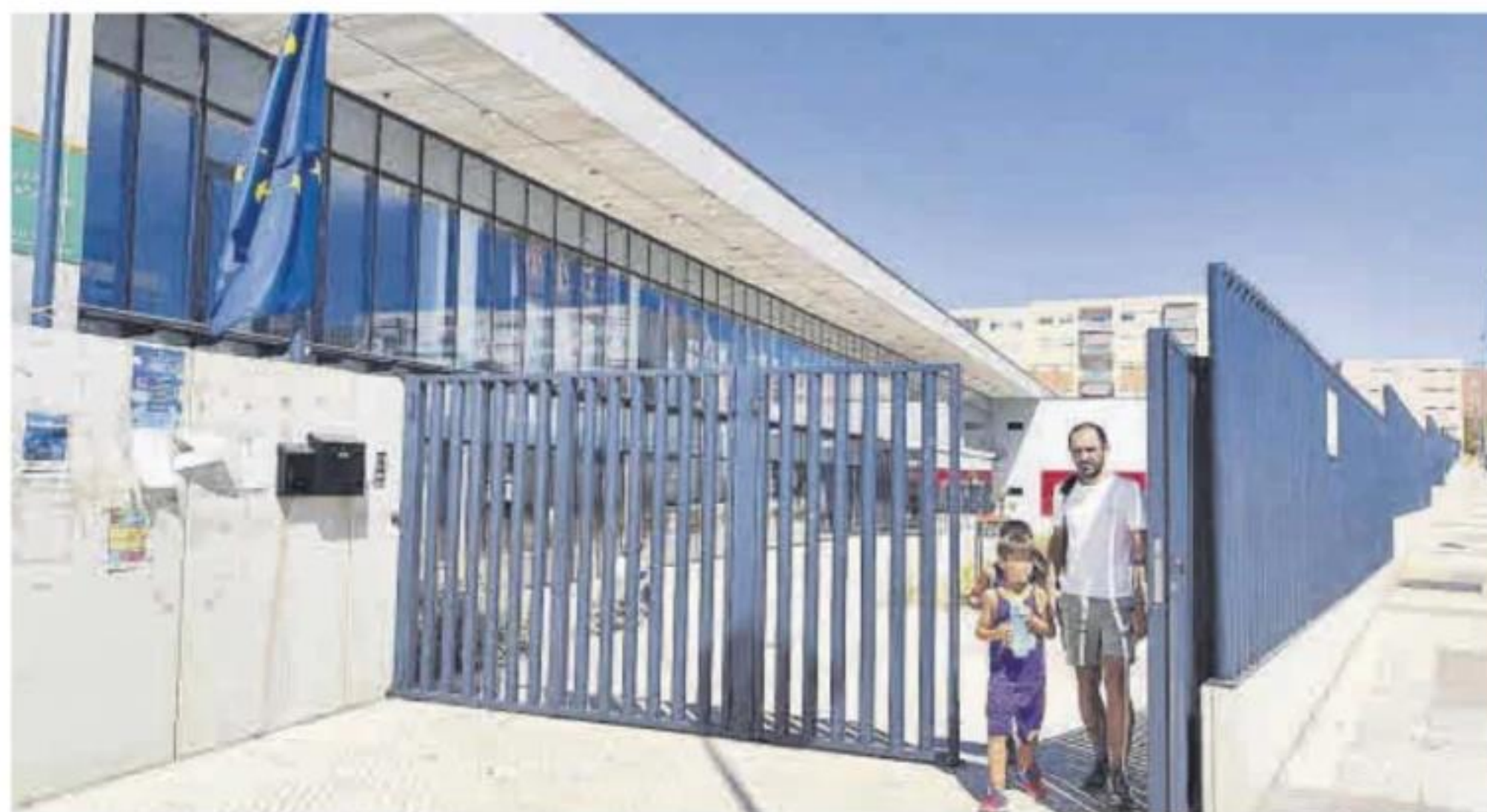
Exterior del colegio público Mirador de Cerro Gordo, en la barriada del mismo nombre.

Durante el periodo de garantía el contrato de las obras de construcción del colegio, que cuenta