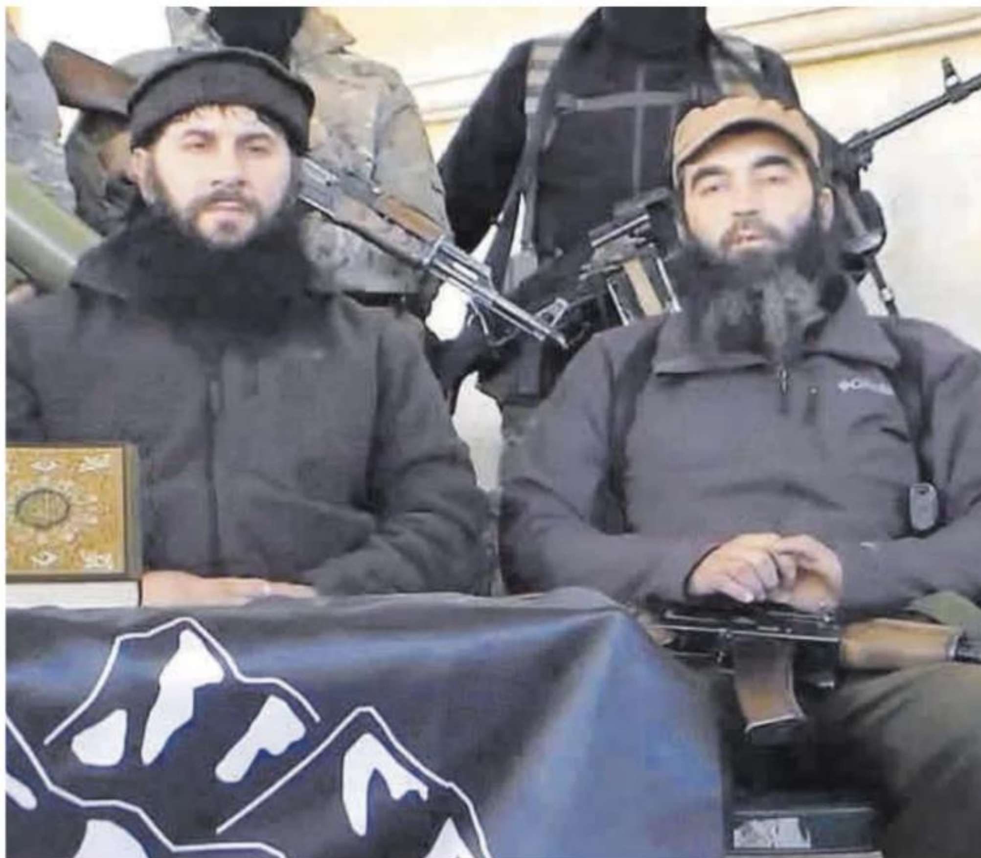
Dos dirigentes del yihadismo checheno en una imagen localizada en el ordenador del menor detenido en Sitges.

Todo lo hizo con un intenso uso del móvil y el ordenador, en su casa de Sitges, sin que los padres sospecharan a qué se dedicaba.