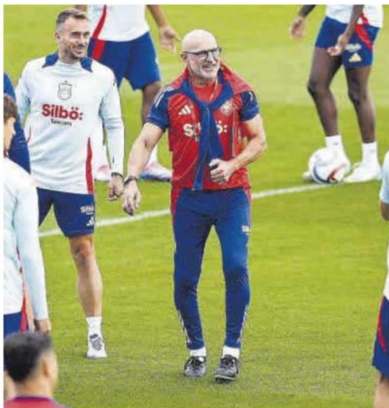
Luis de la Fuente, durante un entrenamiento de la selección.

Tras volver a enganchar a todo un país a una selección que bordó el fútbol en una Eurocopa en la que firmó pleno de triunfos, derrotando en su camino al éxito a los rivales más poderosos, España regresa asegurando mantener intacta la ilusión y el hambre de éxito.