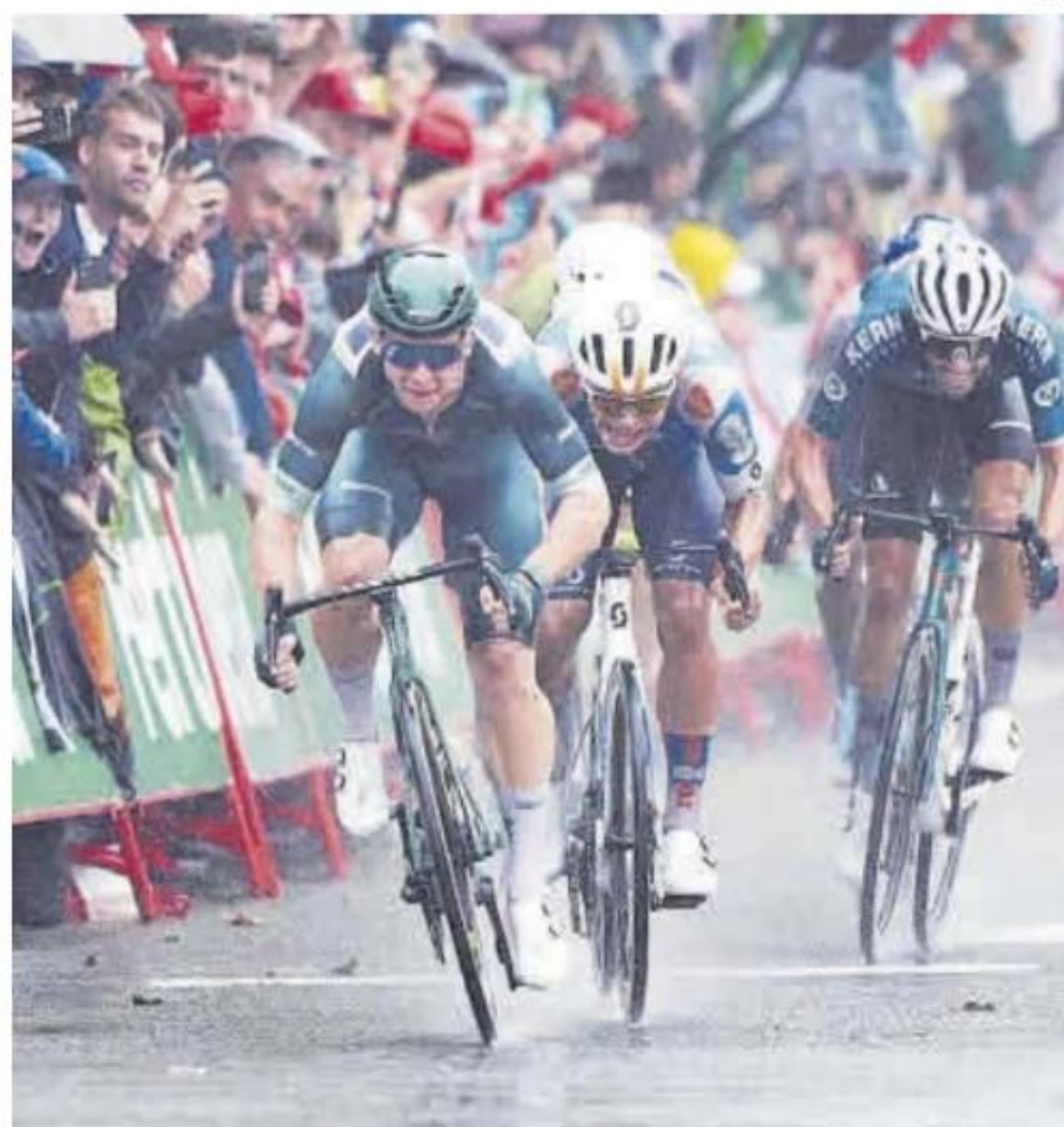
Esprint en la llegada a Santander.

ETAPA 18 HOY 179,3 KM VITORIA-GASTEIZ MAEZTU-PARQUE NATURAL DE IZKI