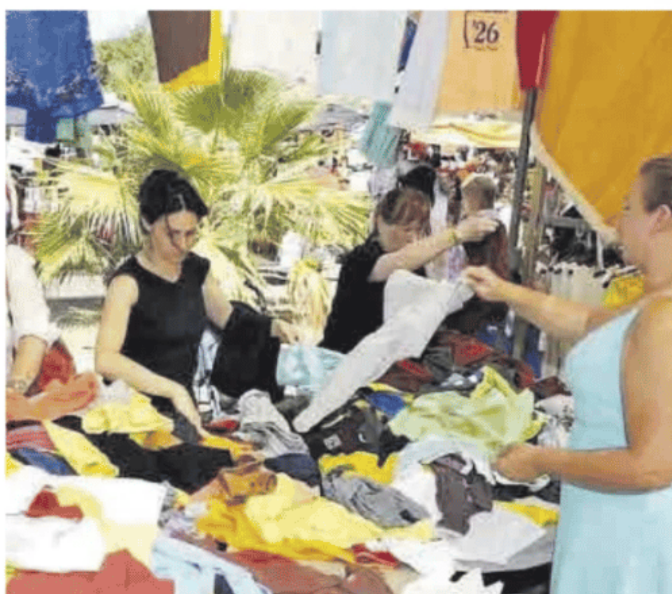
Ventas en el mercado franco de Vegas del Mocho.