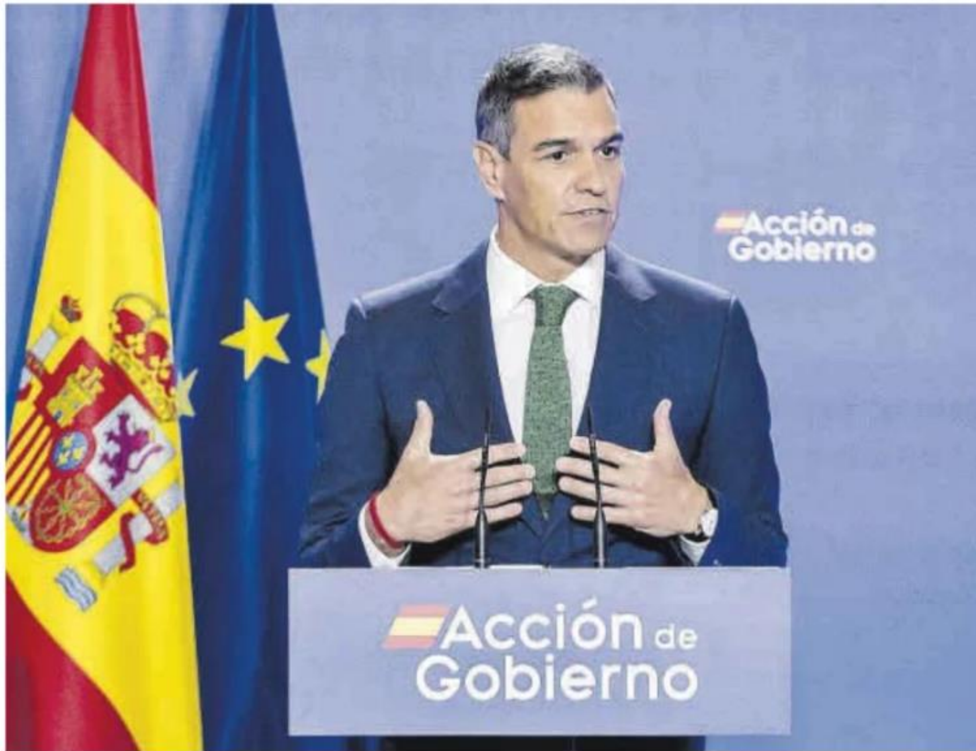
Pedro Sánchez, durante su comparecencia ante los medios, ayer.

El anuncio viene a meter presión al PP, cuyos presidentes autonómicos defienden fórmulas distintas de financiación y se verán ahora en la difícil tesitura de mantener su oposición dura o sentarse a negociar un nuevo sistema que, en teoría, les va a beneficiar. «Me comprometo que con la fórmula que vamos a proponer todas las autonomías recibirán más recursos de los que recibían mientras gobernaba el PP», insistió Sánchez, que en ningún momento se refirió al controvertido pacto con ERC para invertir a Salvador Illa como presidente de la Generalitat, que ha provocado un enorme malestar entre numerosos líderes te-