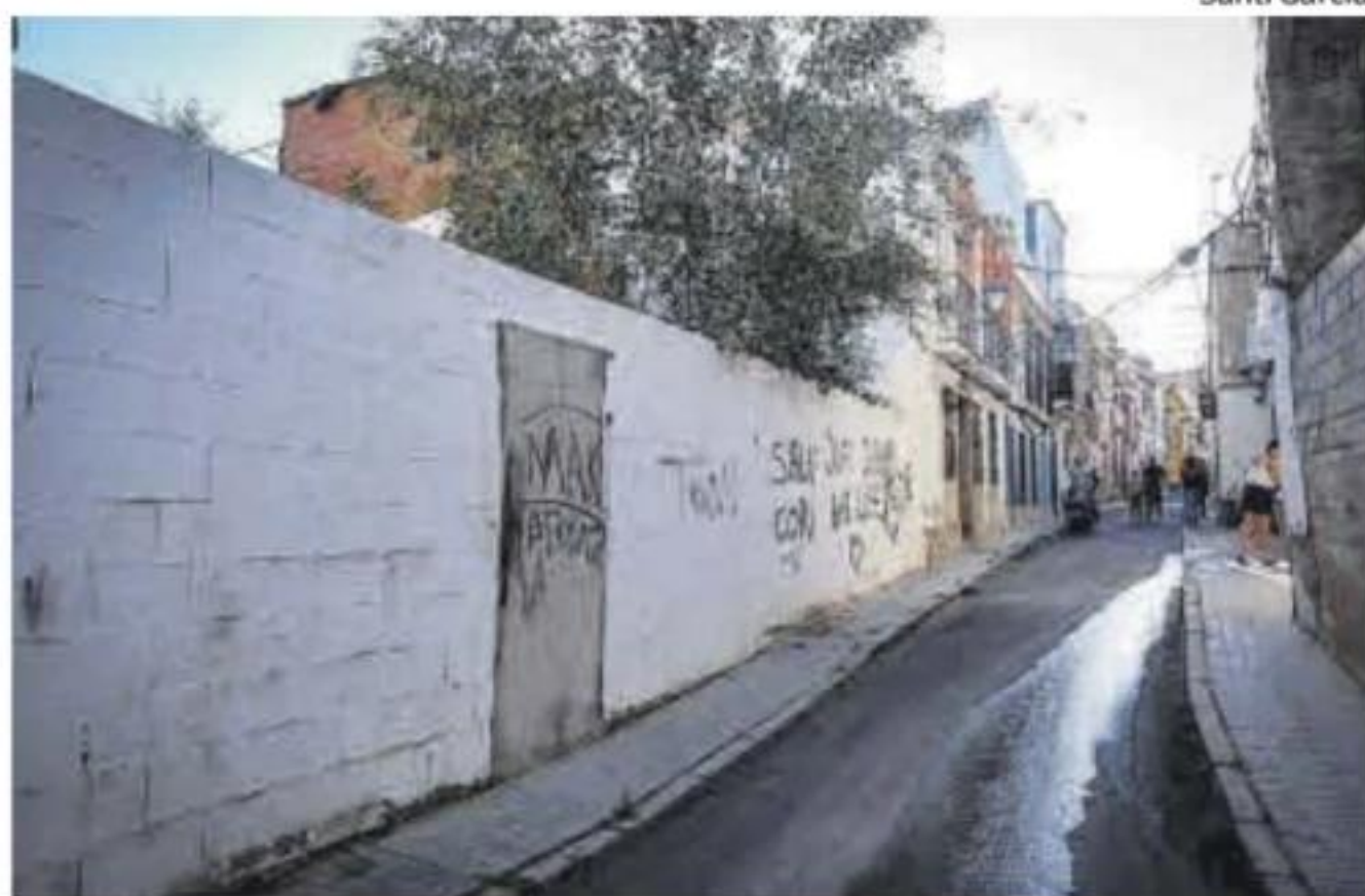
Otro de los solares abandonados de la calle Amparo.