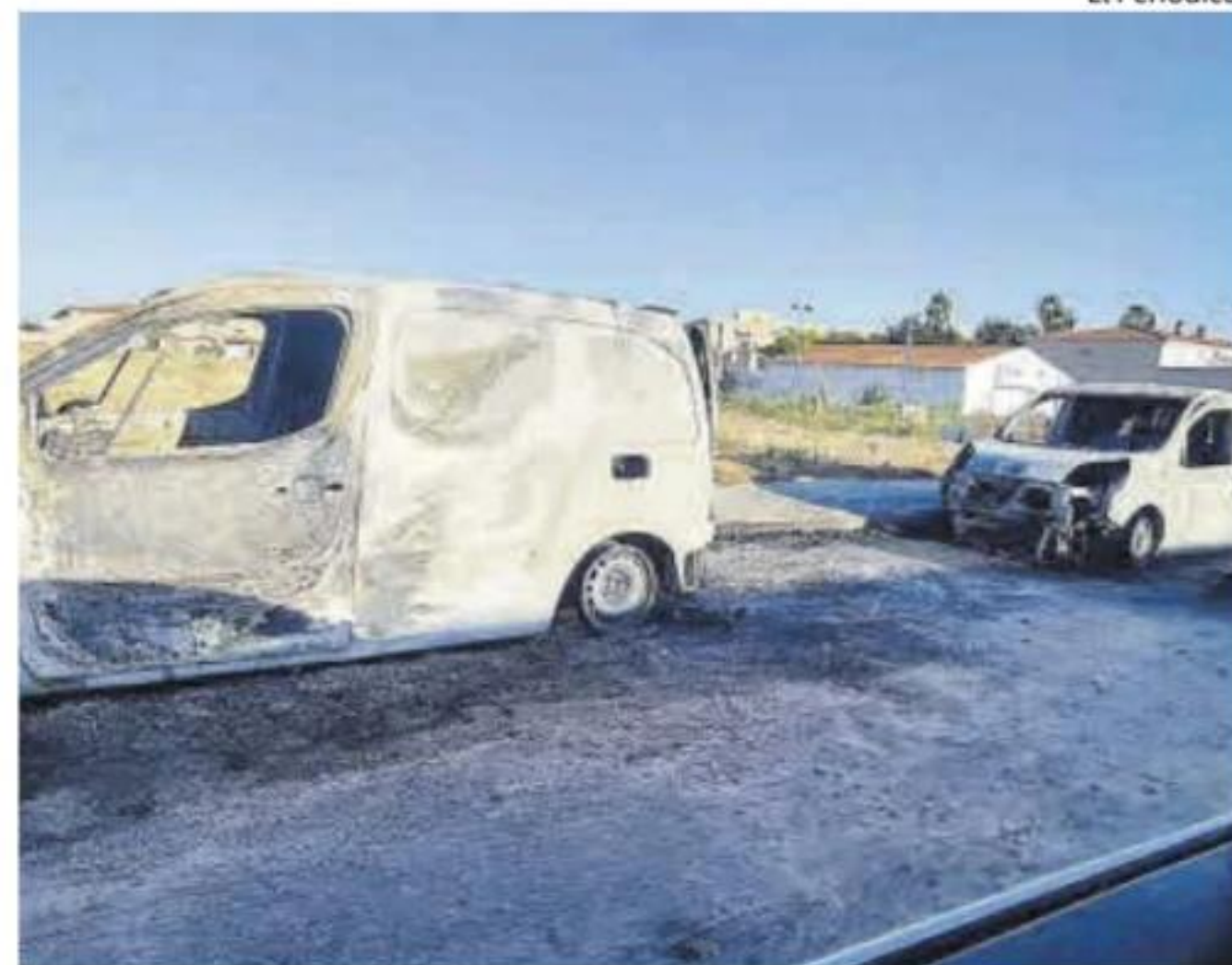
Las dos furgonetas calcinadas en la barriada de Llera.

A pesar de los esfuerzos de la Policía Local por encontrar a sus propietarios, por ahora no hay resultados. Los habitantes de esa zona aseguraban que ambos vehículos llevan ahí tres meses «como poco. Es muy raro, no sabemos de