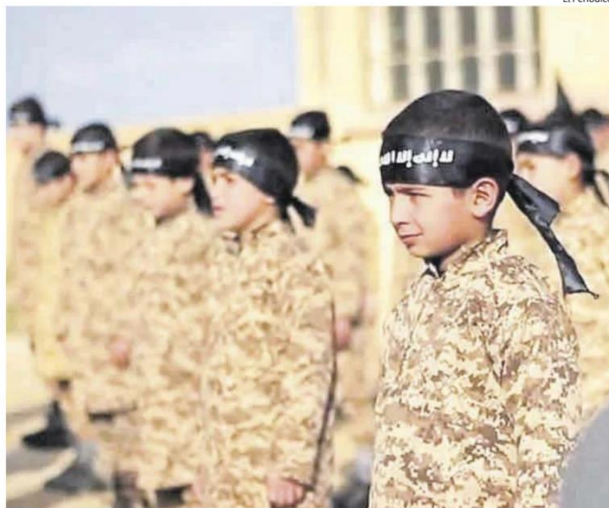
Niños soldado, los llamados «leoncitos del califato», en un campo de entrenamiento en Siria.

Los expertos en lucha antiterrorista de la Jefatura de Información del instituto armado han tomado esta decisión después de observar cómo se repiten dos fenómenos: por un lado, la sorpresa mayúscula de los padres, que no suelen saber nada de las andanzas