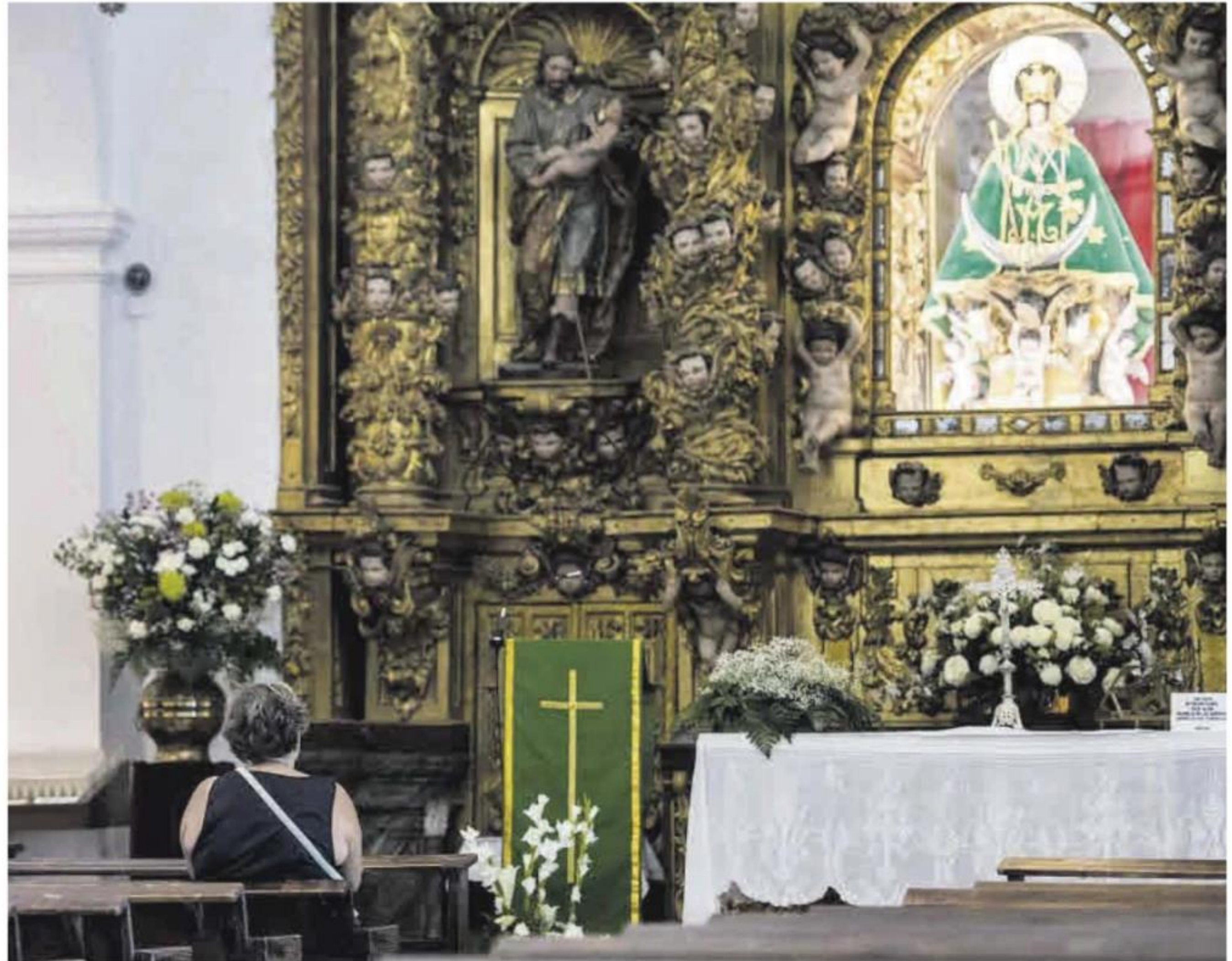
Una mujer observa a la Virgen de la Montaña sentada en uno de los bancos frente a la imagen.

Ha asegurado que desde siempre ha sentido «mucha devoción» hacia la imagen, por ello antes iba mucho a visitarla al Santuario, pero «ahora ya no puedo porque me cuesta mucho subir las cuestras esas tan grandes, pero si tengo ocasión yo me llevo a mi marido en