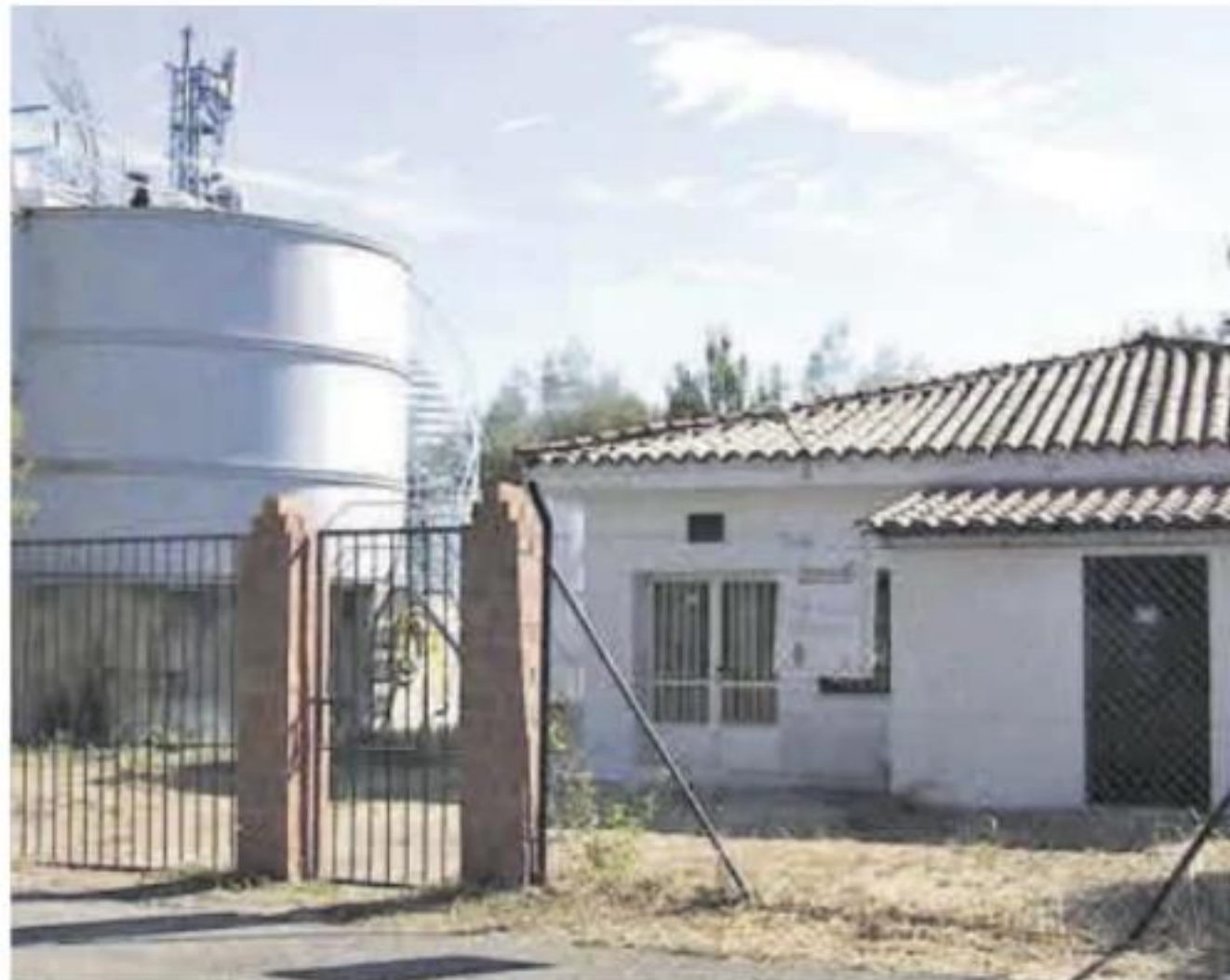
Depósitos de agua de Barrado.

Todo comenzó el pasado viernes, cuando el trabajador encargado de los depósitos de agua que llegan desde el pantano que suministra a los municipios del Valle del Jerte descubrió «vertidos inusuales» en las tapaderas de los depósitos. Inmediatamente, se cortó el abastecimiento del agua y se puso en conocimiento de la Guardia Civil.