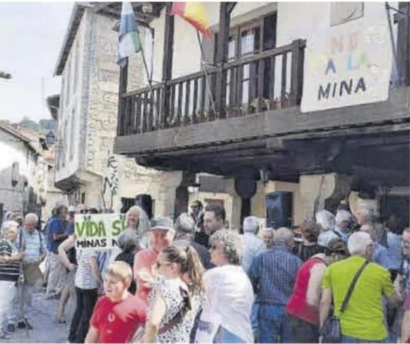
Protestas contra los proyectos mineros en Sierra de Gata.

cía de varios errores, en concreto la designación del perímetro solicitado y el número de cuadrículas mineras; los organismos a los que se solicitarían informes; y el órgano competente para resolver sobre la autorización administrativa del plan de restauración. Además, con fecha posterior, el promotor «ha presentado una modificación del plan de restauración, a efectos de incluir la afección a los espacios de la Red Natura 2000 correctos y el código LER correcto del residuo minero generado en la ejecución de las labores de sondeos», según recoge la publicación de la consejería. Por todo ello, se procede someter de nuevo a información pública el proyecto de investigación y el plan de restauración.