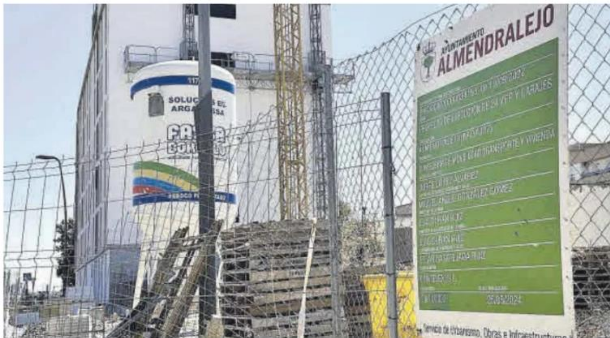
Zona de actuación en la localidad de Almendralejo.

Ballesteros se ha referido en rueda de prensa al reparto de viviendas sociales que debe realizar la Junta de Extremadura en un proceso en el que también participa el ayuntamiento. El pleno municipal previo al verano determinó una comisión evaluadora para la adjudicación de estas viviendas, repasando determinados parámetros y teniendo en cuenta la lista de aspirantes que ya manejaba el ayuntamiento en 2023. Ese listado previo ha sido trasladado a la Junta de Extremadura, que es la administración competente para analizar este listado provisional y aprobar el listo definitivo de adjudicatarios.