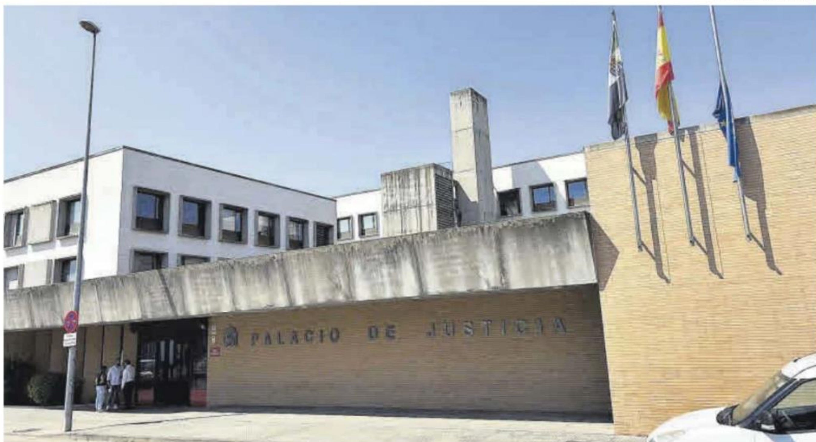
Palacio de Justicia de la capital extremeña, ubicado en la avenida de las Comunidades.

El Juzgado de Primera Instancia e Instrucción número 3 de Mérida ha ordenado que continúen las diligencias por el caso de la Brigada de Estupefacientes de la comisaría de la Policía Nacional de la capital extremeña, según ha señalado un auto al que ha tenido acceso este periódico. Fue el 16 de abril de 2021 cuando la unidad de Policía Judicial (Grupo IV de Asuntos Internos de la Policía Nacional) solicitaba autorización judicial para la intervención telefónica, la instalación de una cámara de video-vigilancia y un dispositivo de audio en el despacho del Grupo de Estupefacientes de la citada comisaría en la ciudad y la instalación de un Software de registro remoto en el terminal telefónico. En el atestado inicial se ha dado cuenta de que, por varios cauces de información, la unidad de asuntos internos tenía conoci-