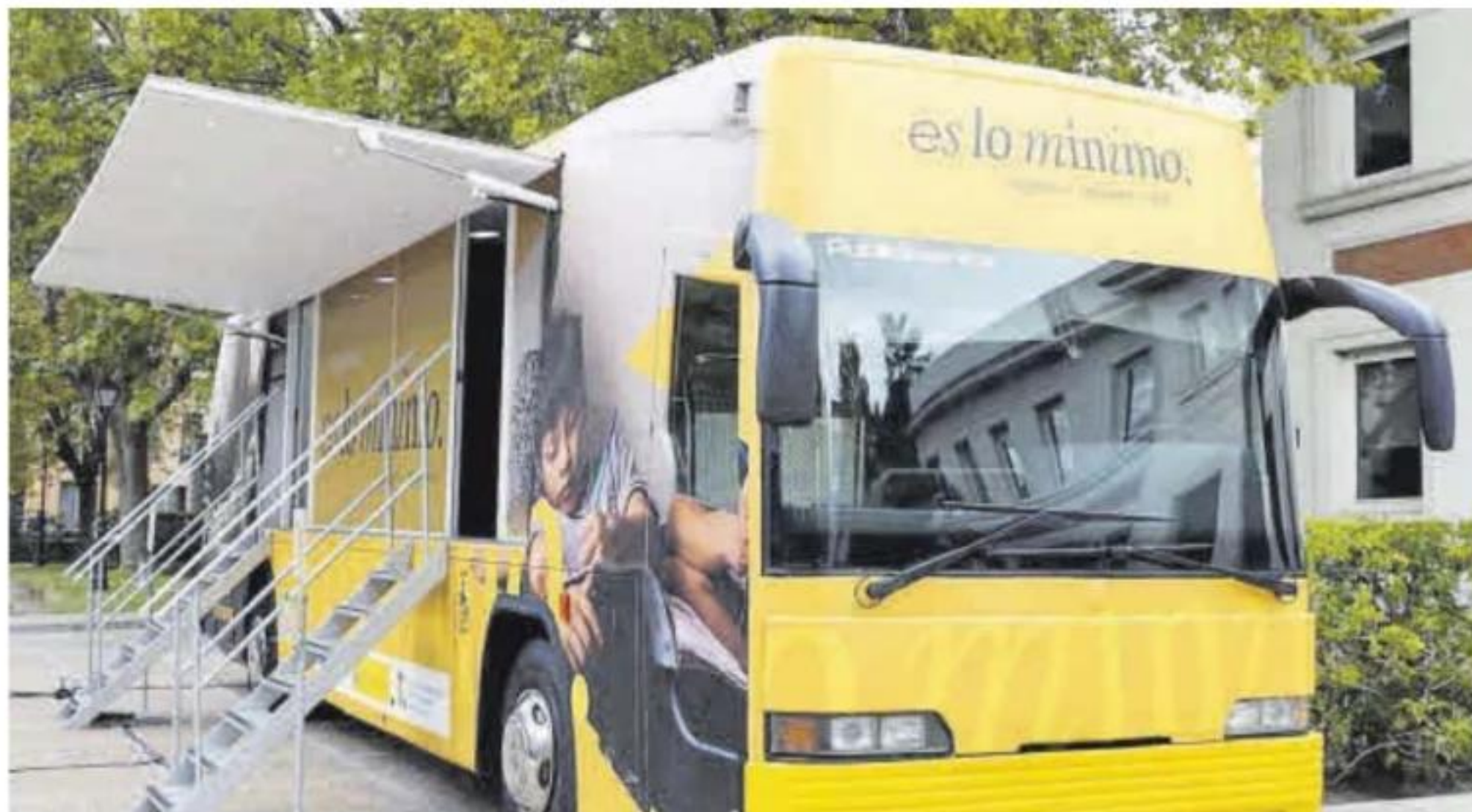
El autobús del ingreso mínimo vital a su paso por Extremadura, en una imagen de archivo.

Por otro lado, en términos acumulados desde junio de 2020, cuando se puso en marcha esta prestación, en plena pandemia por el covid-19, el ingreso mínimo vital ha llegado a 31.986 hogares y ha protegido a 94.452 personas; de ellas, 65.275 pertenecen a Badajoz y 29.177 a Cáceres.