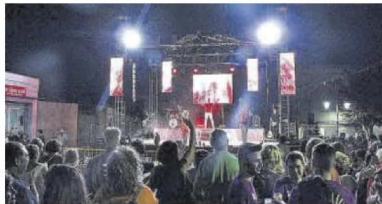
Las verbenas son una de las señas de identidad de las ferias arroyanas.