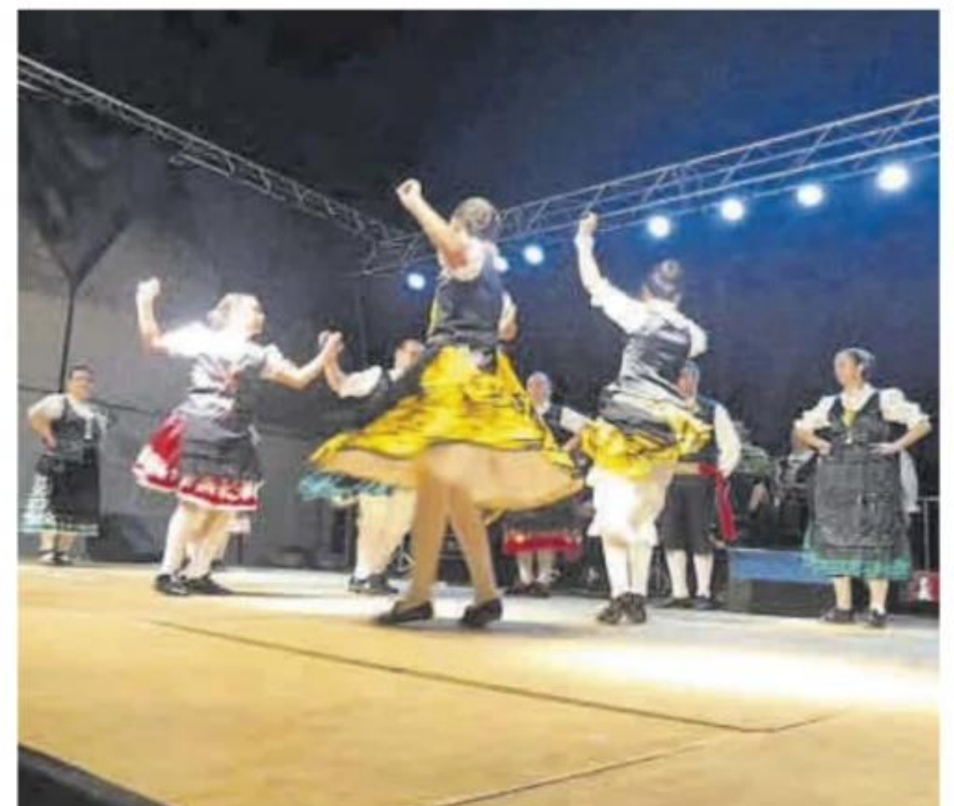
Actuación de Amanecer Extremeño, durante un festival anterior.