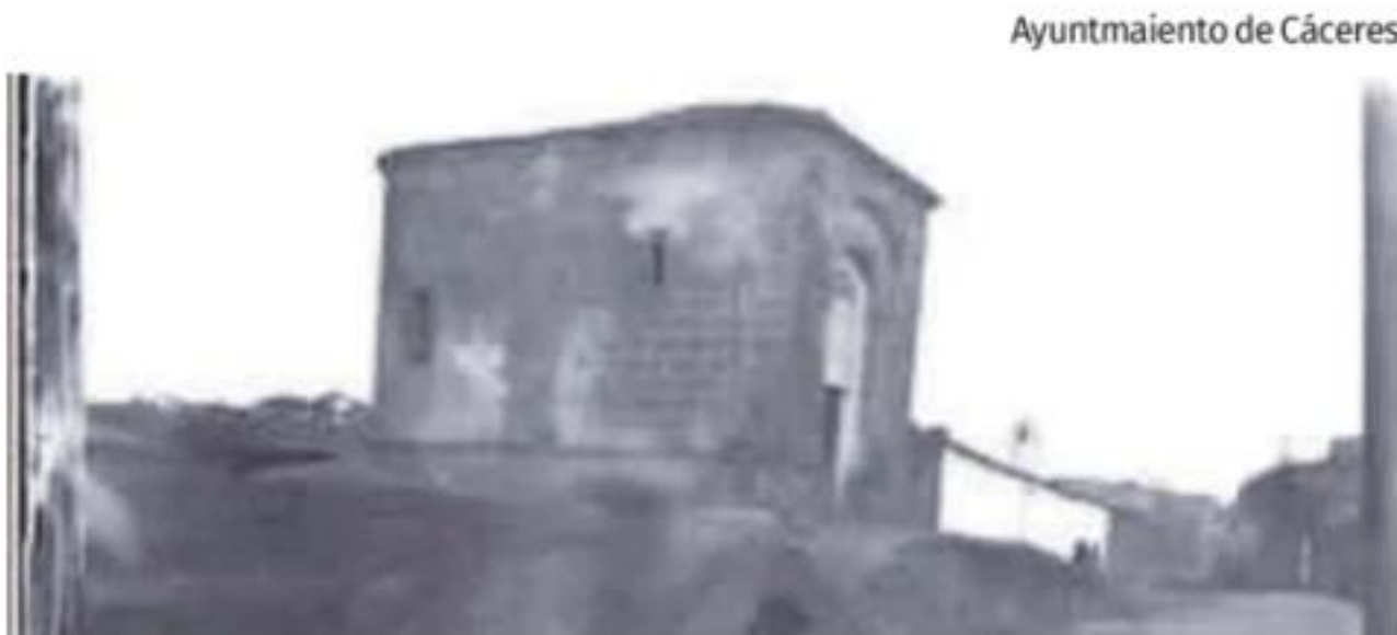
Imagen del lavadero de lanas en 1764.