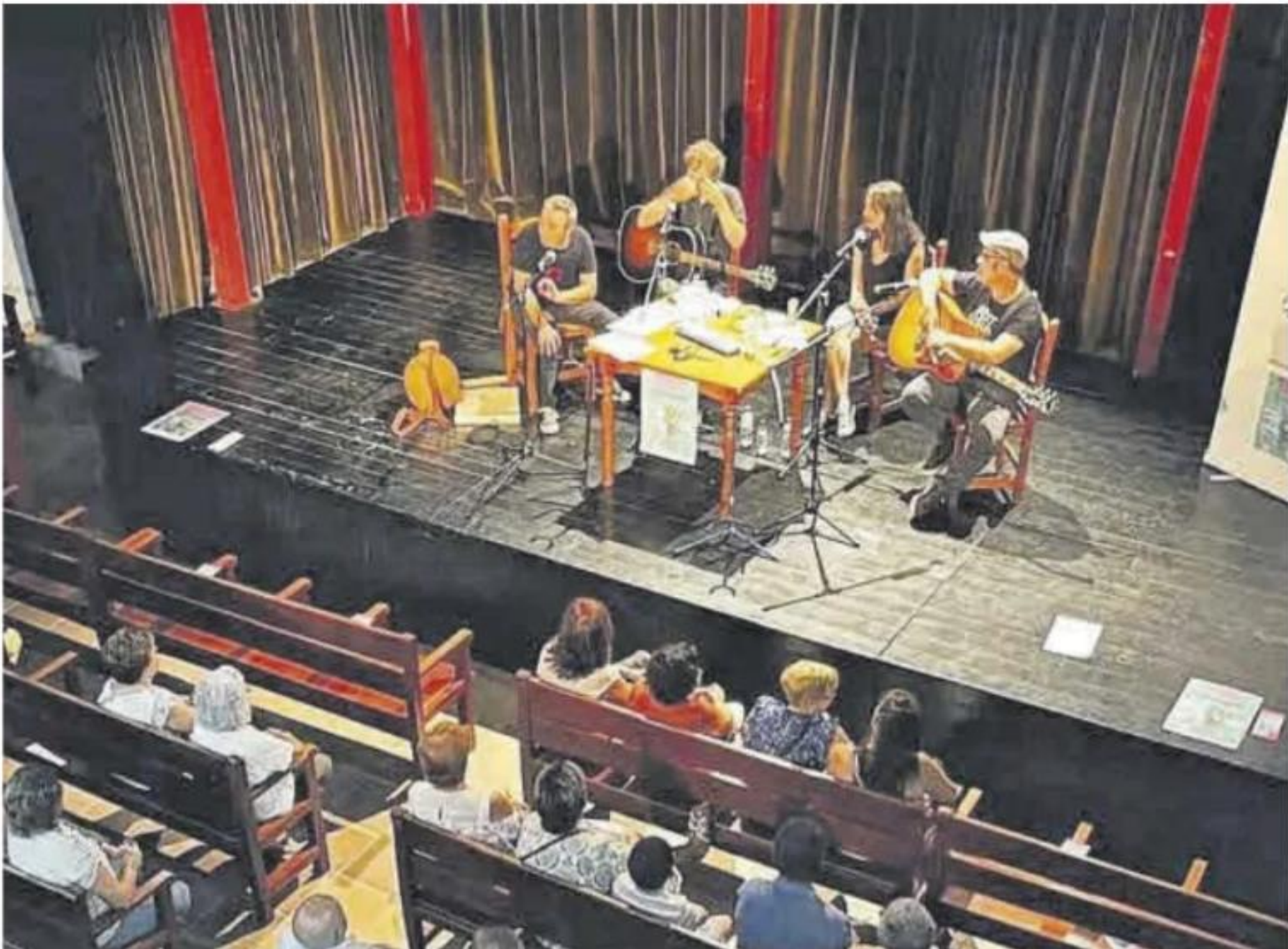
Presentación en el Corral de Comedias de Garrovillas de Alconétar del Aguas Vivas Fest.

Hasta allí se desplazará la tienda itinerante de ropa sostenible que lleva recorriendo numerosas poblaciones de la provincia de Cáceres desde la pasada primavera. Precisamente, la presentación oficial de la primera tienda itinerante de moda responsable de Cáritas Española, de la mano de la empresa cacereña de economía social Remudarte (de Cáritas Diocesana de Coria-Cáceres), se presentó el pasado mes de marzo en la monumental plaza porticada de Garrovillas de Alconétar, donde también