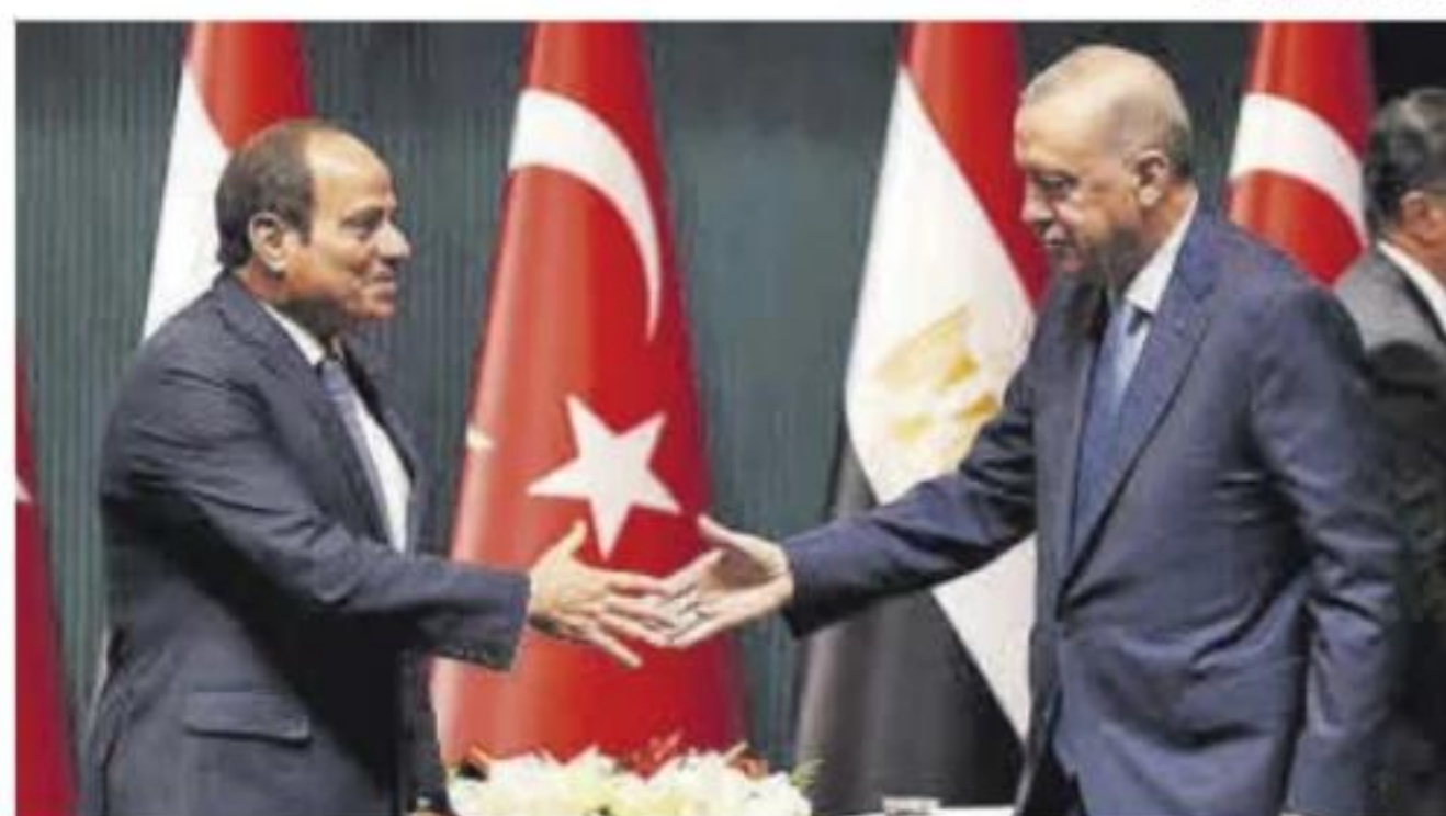
Al Sisi, izquierda, y Erdogan, ayer, en Ankara.

entre Turquía y Egipto, los presidentes de ambos países, Abdelفتاح al Sisi y Recep Tayyip Erdogan, escenificaron ayer el final de una década de rivalidad regional entre el país anatolio y el país árabe. Así, el presidente egipcio viajó por pri-