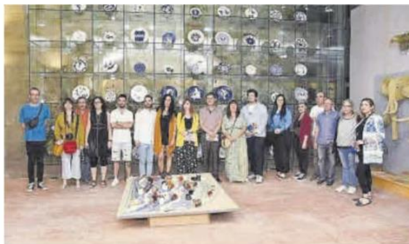
Inauguración de la muestra 'Extrujarte', en una edición anterior.