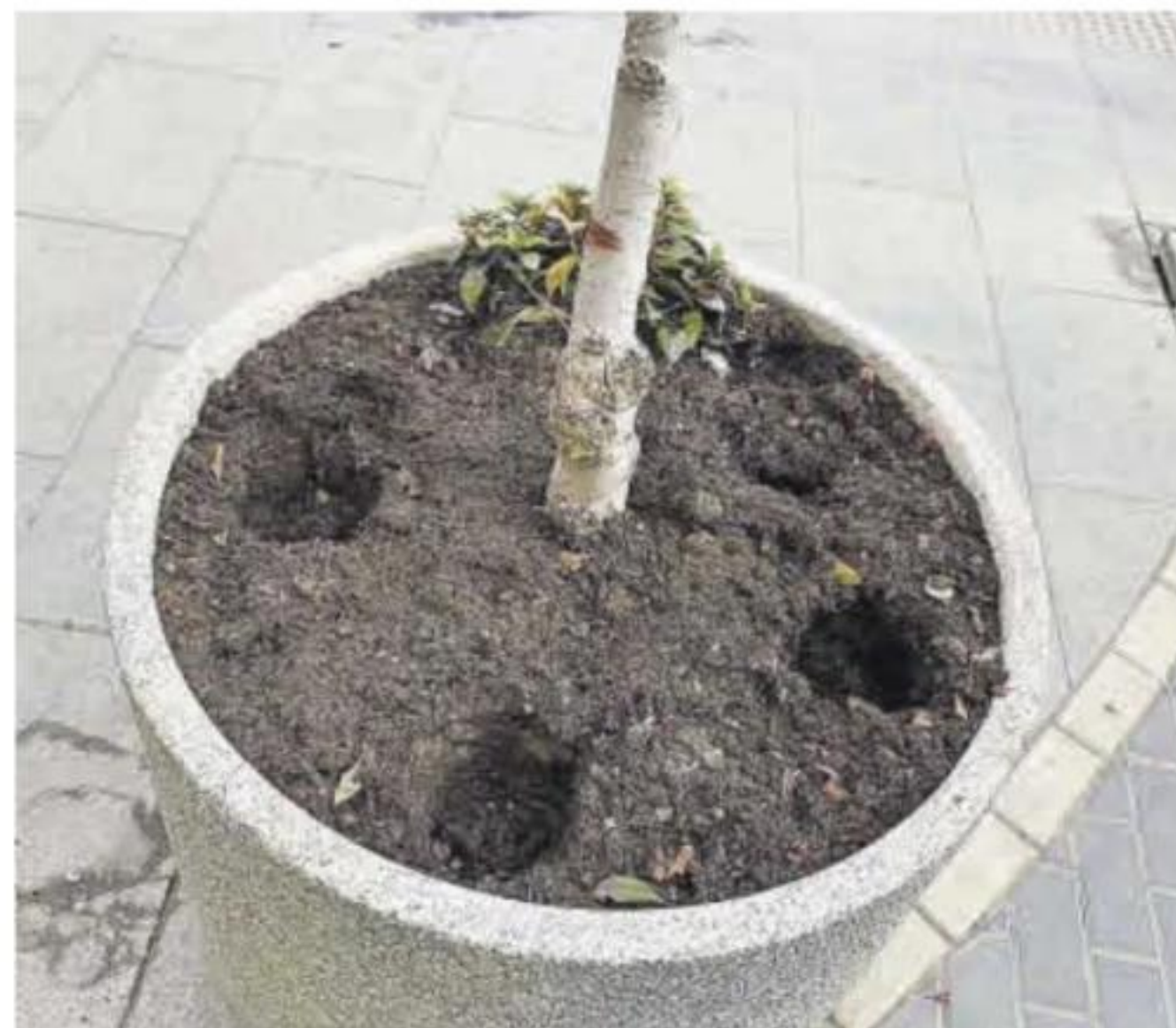
Macetero en el que se observa la sustracción de varias plantas.

los daños ocasionados. «Han arrancado árboles y roto aspersores, insistimos en la educación y colaboración ciudadana para que esto no ocurra», apostillan desde la empresa municipal, que viene denunciando actos de este tipo durante las últimas semanas en la localidad. ■