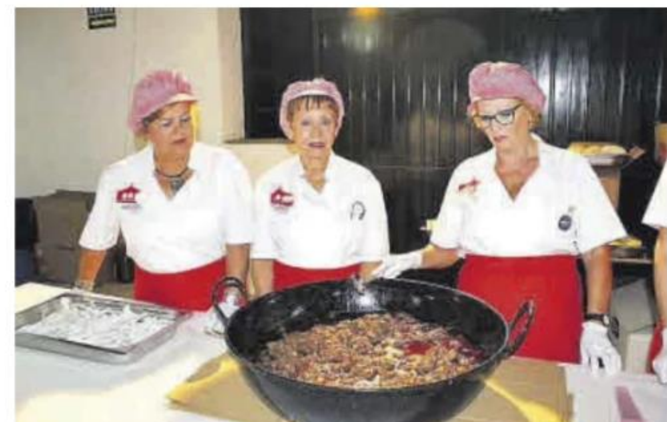
El 13 de septiembre de disfrutará de un frite de carne de toro.