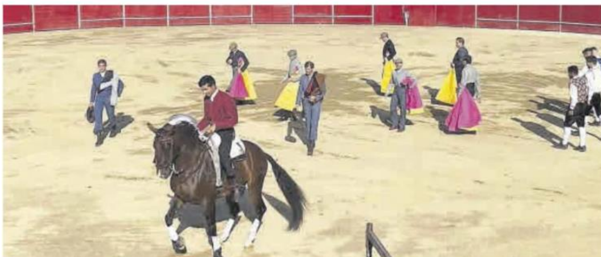
El 15 de septiembre habrá un festival taurino mixto.