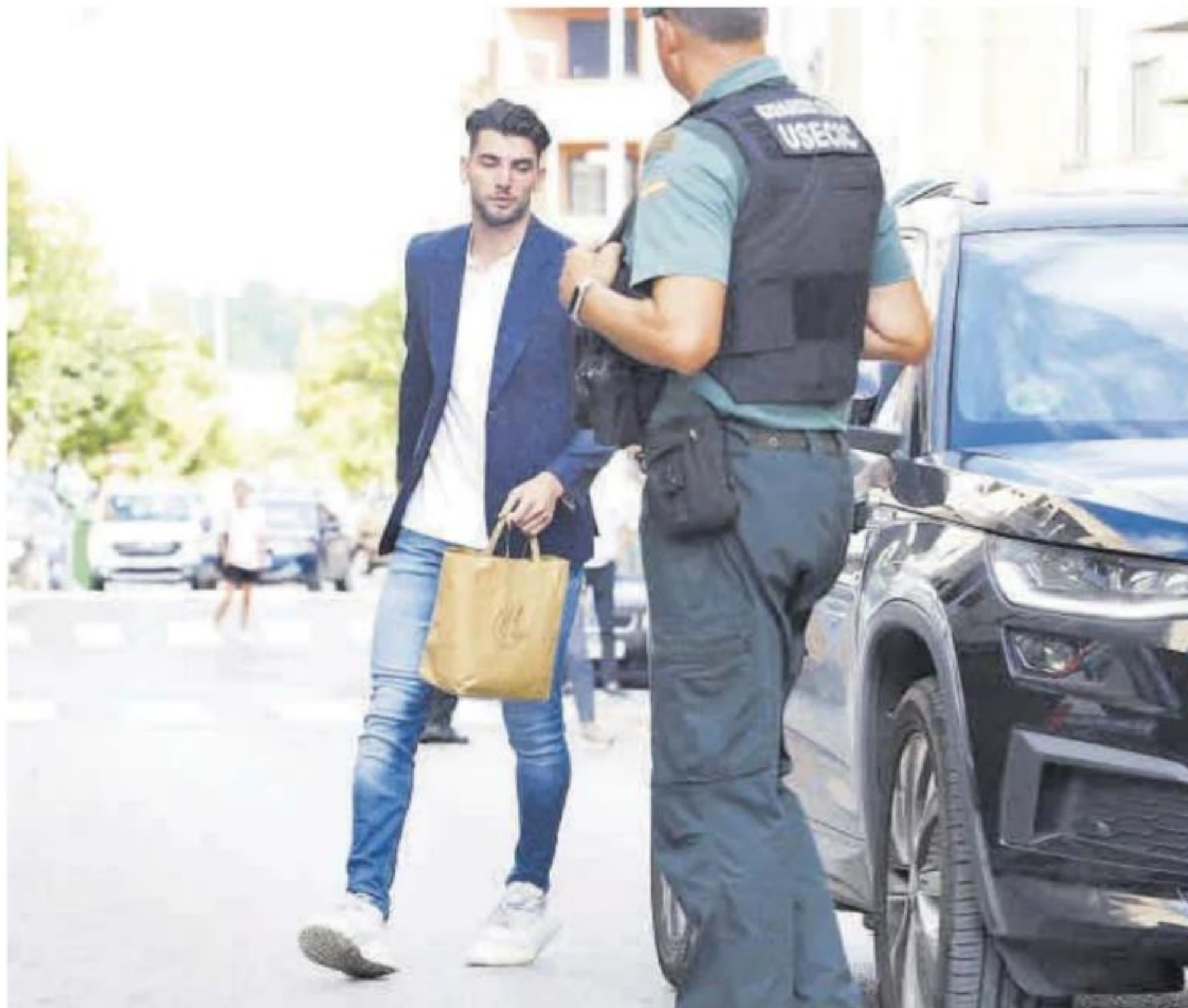
El futbolista Rafa Mir tras ser puesto en libertad después de declarar ante la jueza de Instrucción ocho de Llíria por un delito de agresión sexual con acceso carnal.

El auto de libertad de la jueza tiene en consideración el arraigo del futbolista detenido, ciudadano español con residencia en Bétera.