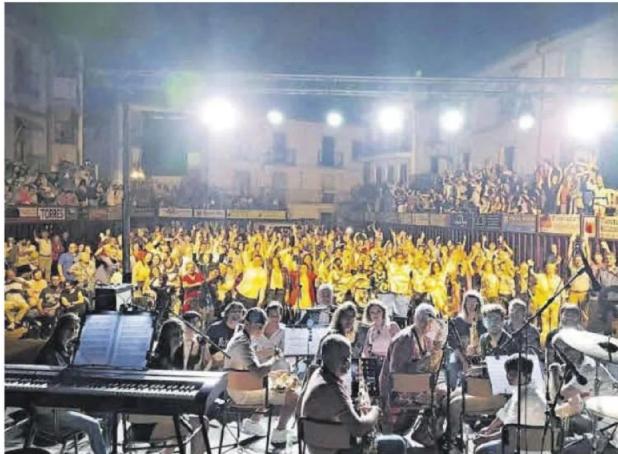
Concierto de fin de curso de los alumnos de la escuela de música, en un año anterior, en Coria.

matrícula son las siguientes. Por un lado, presencial, esto es en la propia escuela en horario de 9.00 a 13.00 y, por otro lado, on line, es decir, a través del siguiente correo electrónico: escuelamusica@coria.org . Para ello habrá que solicitar la matrícula para poder cum-