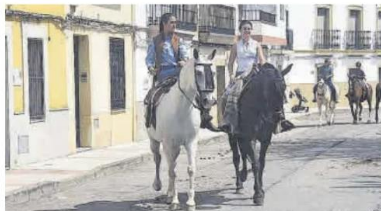
El 8 de septiembre habrá paseo de caballos y carruajes.