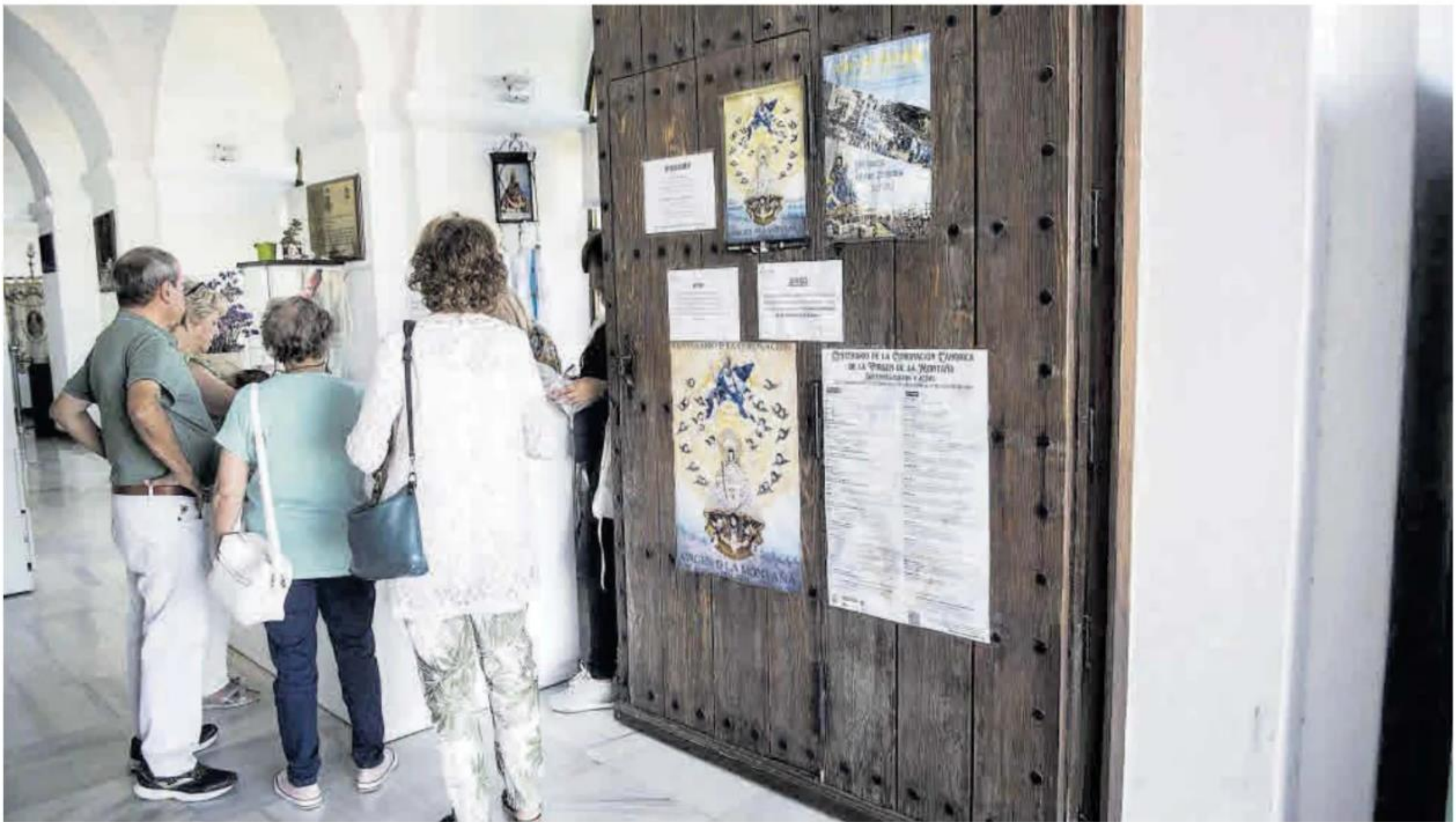
Personas comprando velas en la puerta del Santuario situado en la montaña.

gallega, en mi casa mi padre tenía una gran devoción por la Virgen del Carmen, porque era militar y capitán, todo eso lo he vivido en casa, pero creo que también depende de cómo te lo inculquen y como lo veas, incluso mi marido pertenecía a la cofradía de la Virgen de la Montaña», ha subrayado.