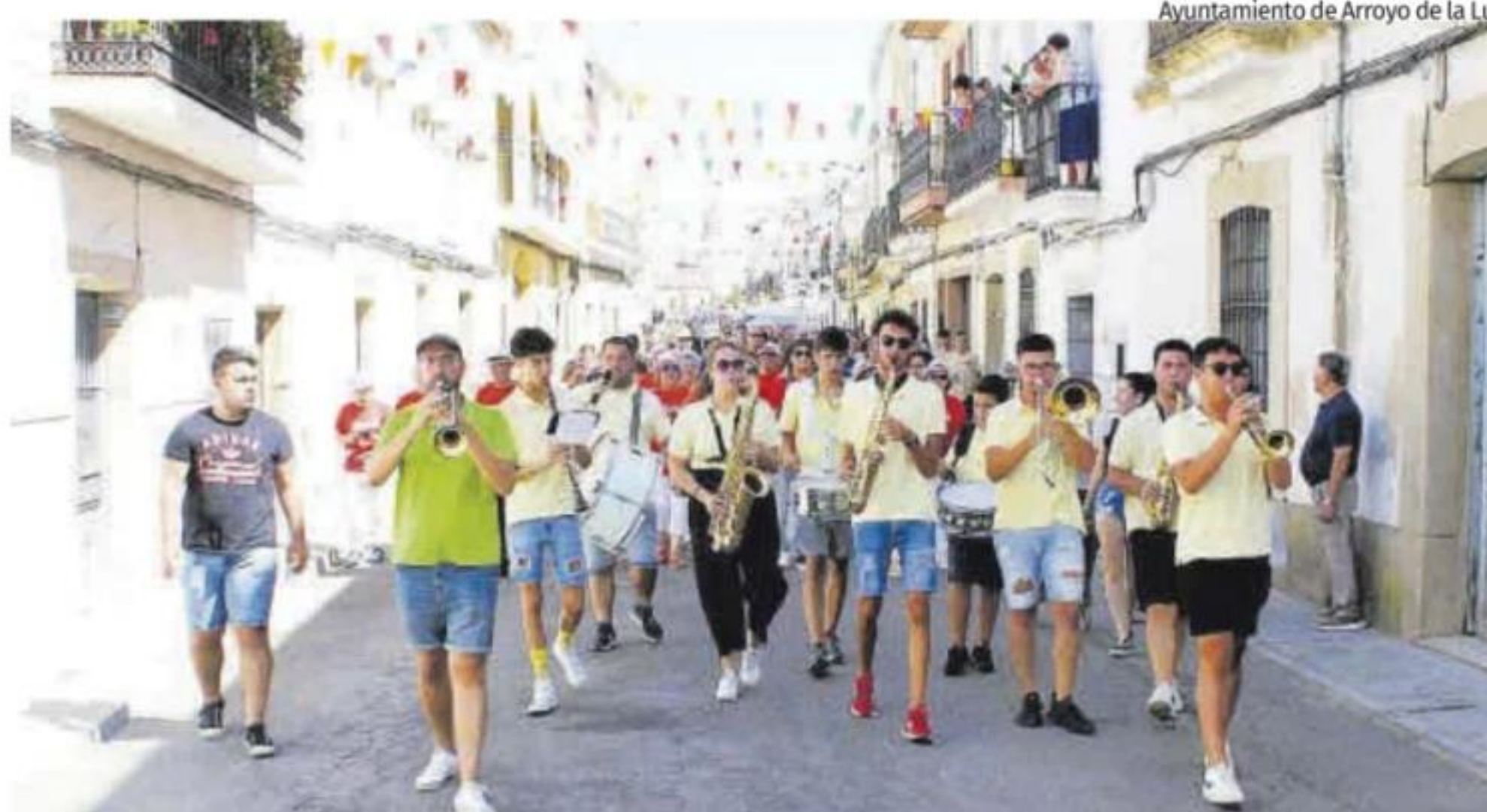
Ayuntamiento de Arroyo de la Luz

El 14 de septiembre se celebra el VII Día de las Peñas.