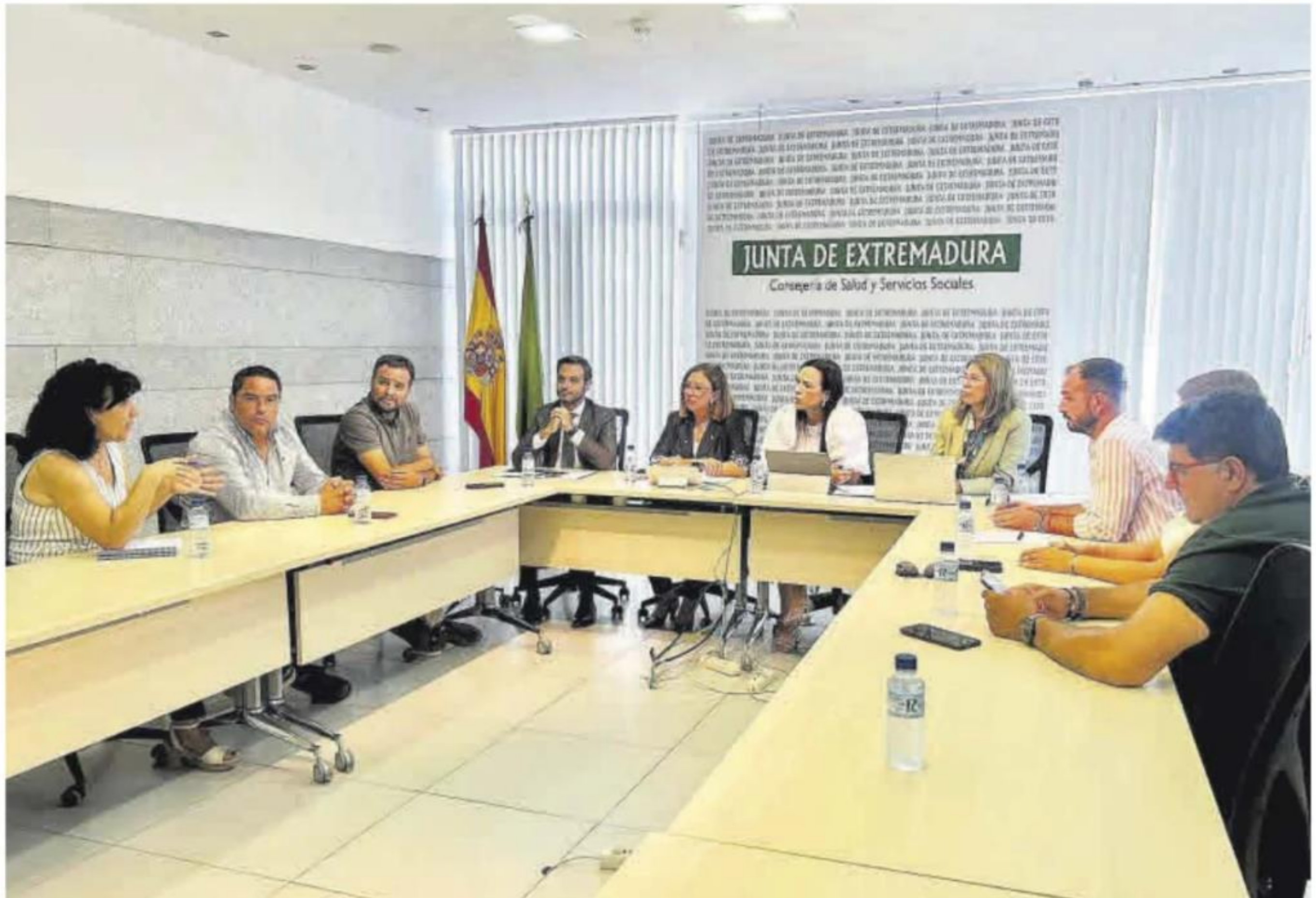
Un momento de la reunión mantenida este miércoles entre los alcaldes de seis municipios de Vegas Altas y las consejerías de Salud y Agricultura.

De otro lado, y de cara a la presente campaña, Agricultura también lleva a cabo fumigaciones para