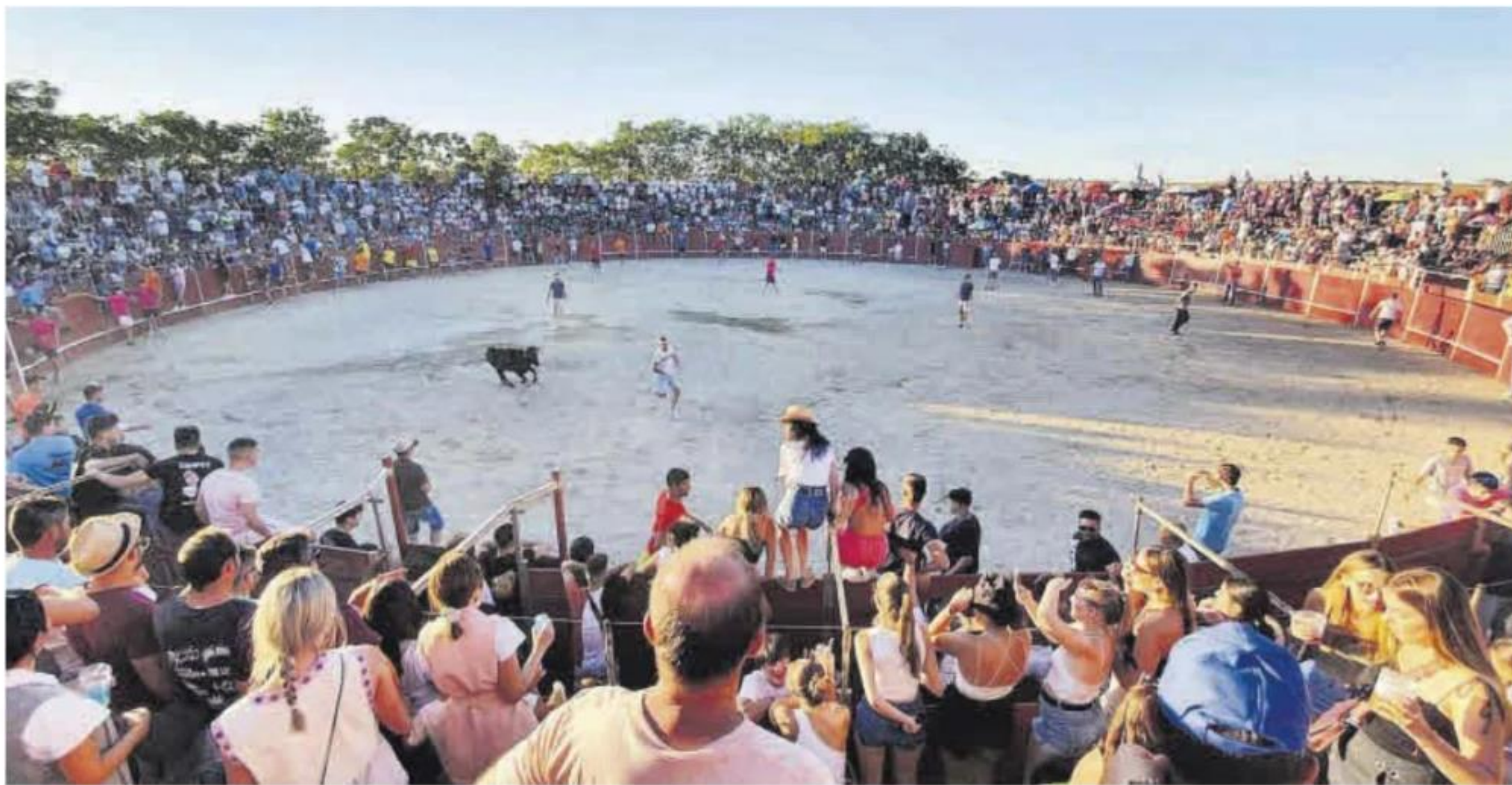
El 13 de septiembre se desarrollará el Gran Prix en la plaza de toros.