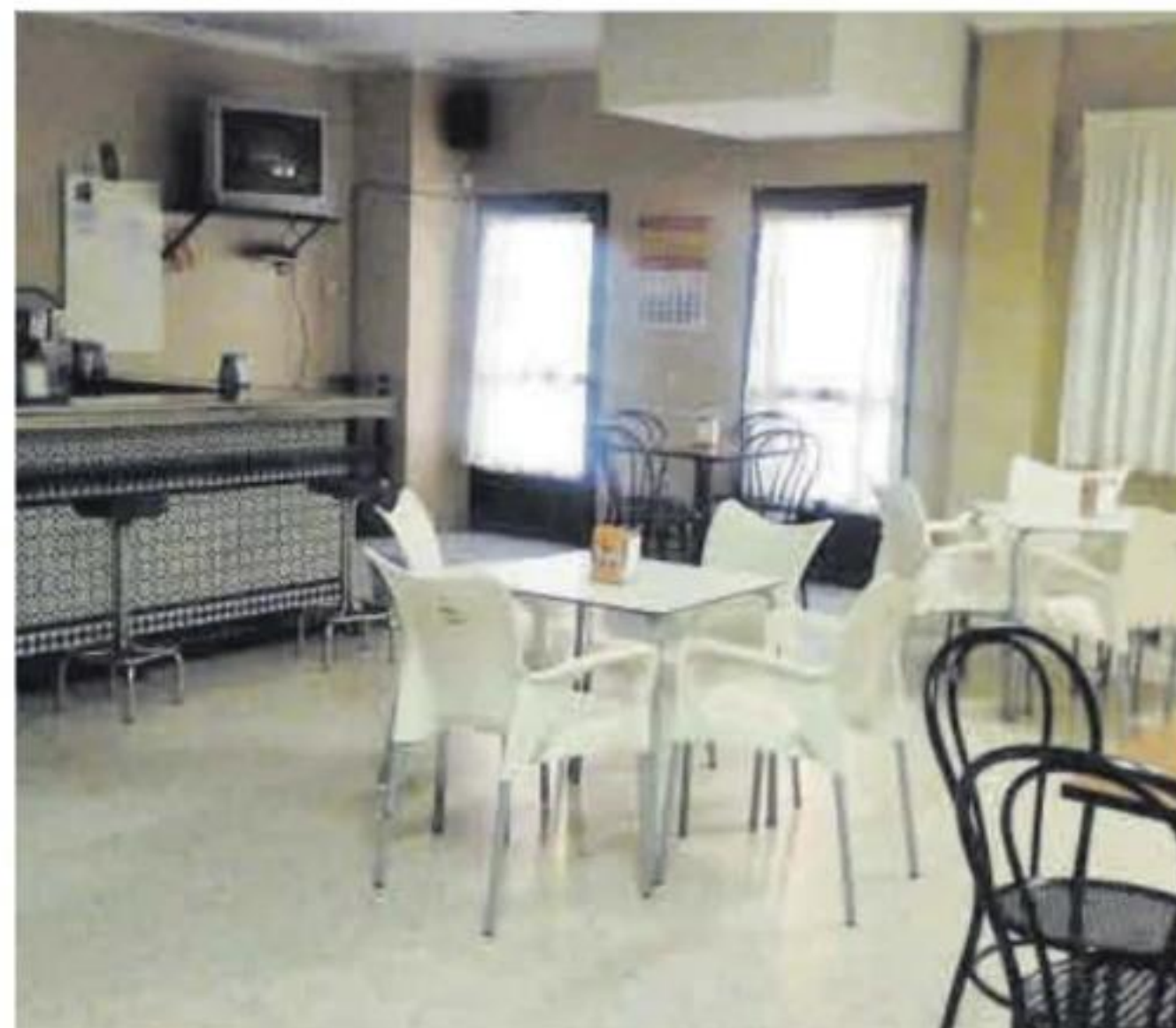
Imagen de archivo de la cafetería hace unos años.

Lo cierto es que son más de cuatro años con la cafetería cerrada y ha habido muchas quejas de los mayores. ■