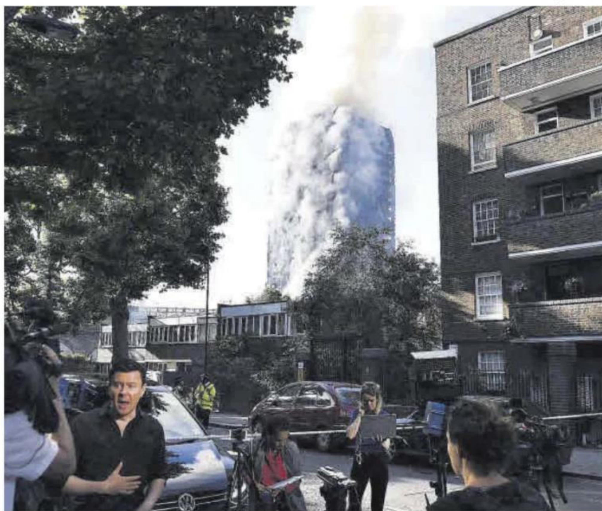
El incendio de la torre Grenfell, en Londres, en junio de 2017.

«Hemos descubierto que hubo una deshonestidad sistemática por parte de los fabricantes, incluidas manipulaciones deliberadas de los procesos de tests e intentos calculados de engañar a los compradores para hacerles creer que los materiales inflamables cumplían con las directrices legales», aseguró Moore-Bick. Otras empresas implicadas, entre ellas Kingspan y Celotex, también han sido acusadas de «engañar». La