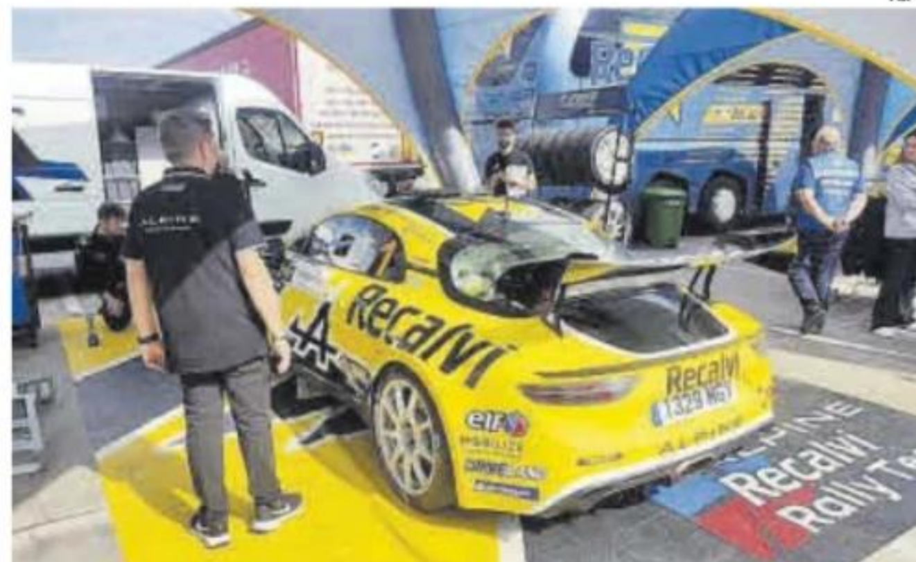
Uno de los vehículos de la pasada edición.

El Rally de la Vendimia abrió a inicios de la presente semana su plazo de inscripciones con un cupo máximo de 90 números, que